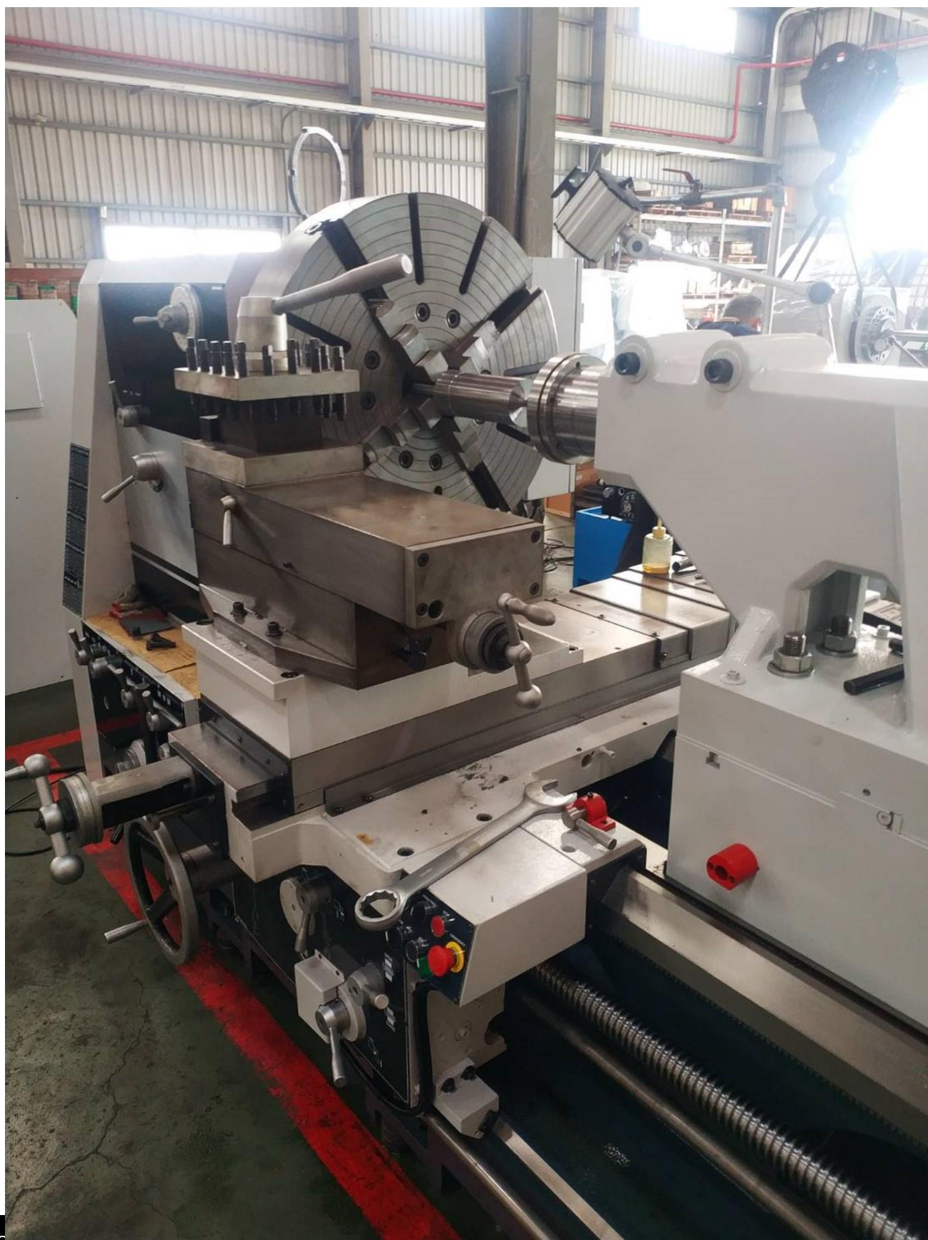
TORNO PARALELO MANUAL CICLONE