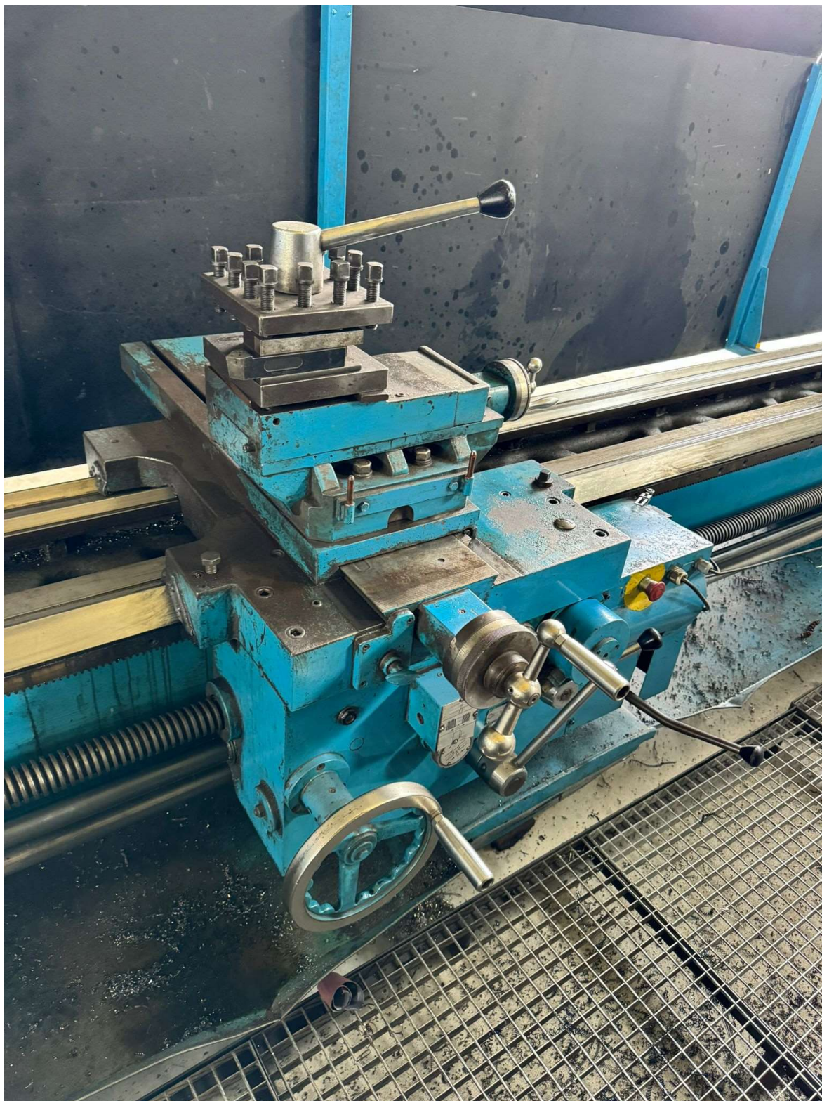
TORNO PARALELO MANUAL ECHEA