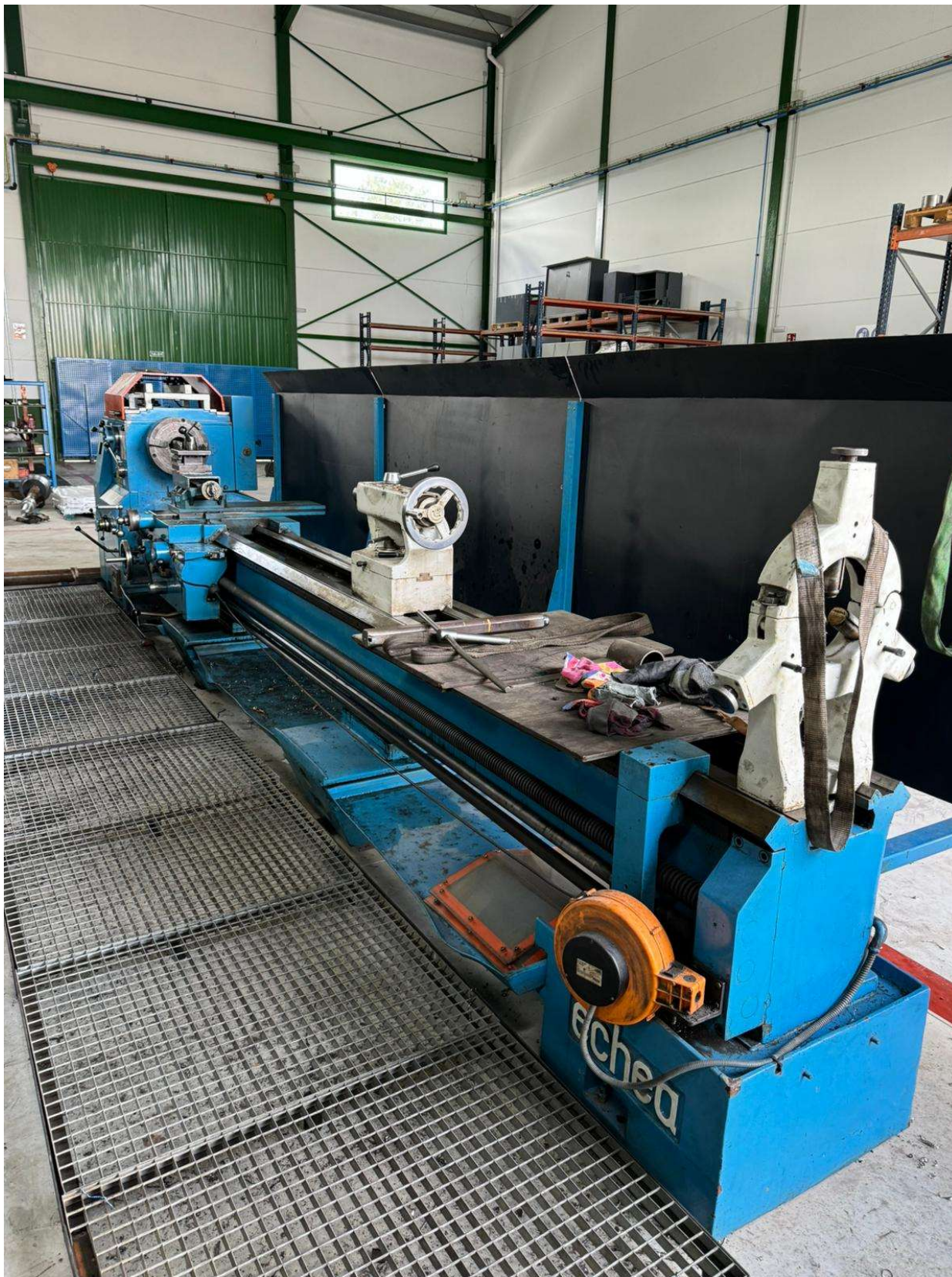
TORNO PARALELO MANUAL ECHEA