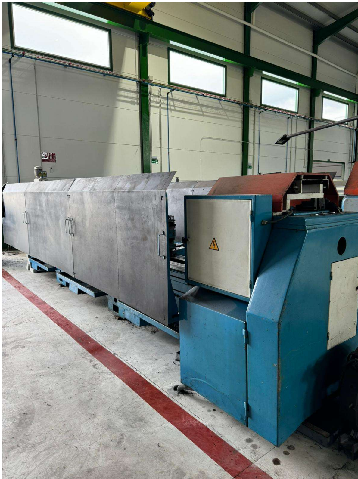
TORNO PARALELO MANUAL ECHA