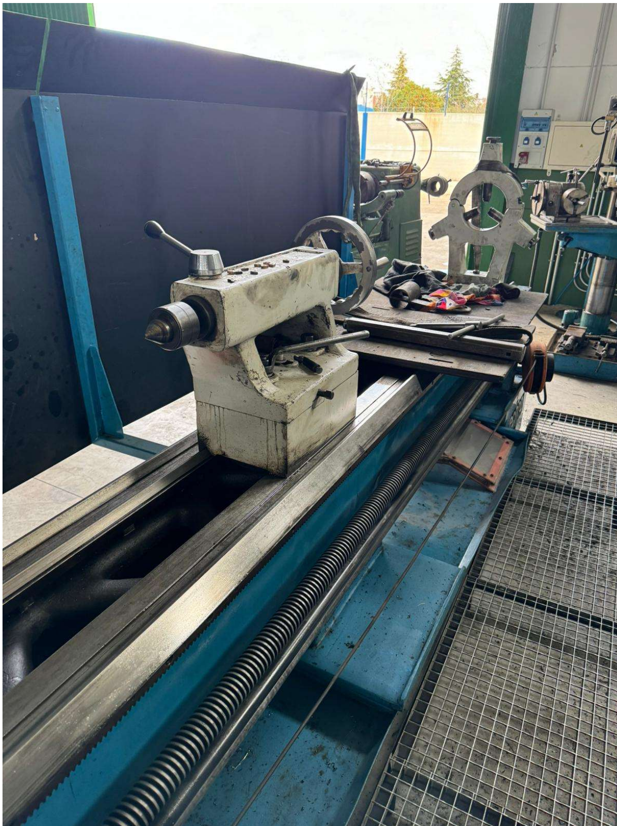
TORNO PARALELO MANUAL ECHEA